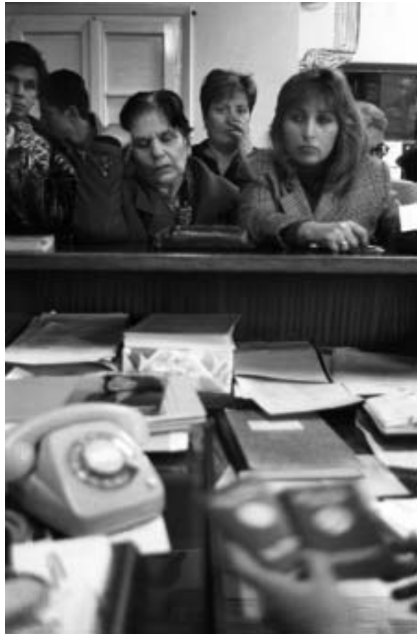
Φωτογραφία: Α. Αβραμίδης, Μετανάστες, 2000

Μπορούν όμως να γίνουν κι άλλα, πολλά περισσότερα. Ο χώρος στον οποίο εργάστηκα— τα μέσα ενημέρωσης— έχει ανάγκη να ανοιχτεί στην κοινωνία. Και η ελληνική κοινωνία δεν αποτελείται μόνο από Έλληνες. Αποτελείται κι από όλους